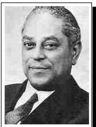
Gaston Monnerville (1897-1991) Parlementaire guyanais ( Témoignage, op. cit. )